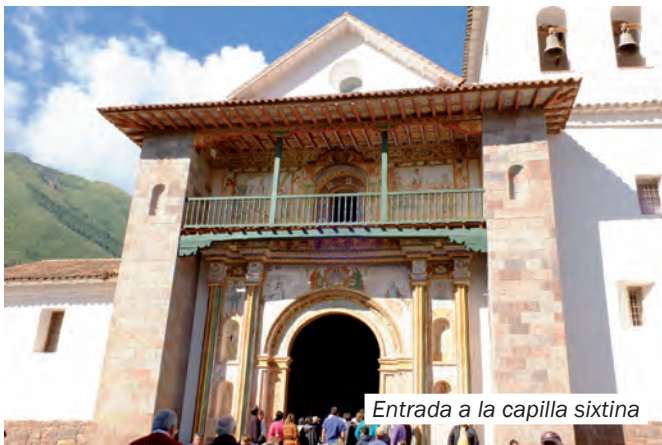
Entrada a la capilla sixtina

Buenas noches en Puno, Perú, buenos días en España.