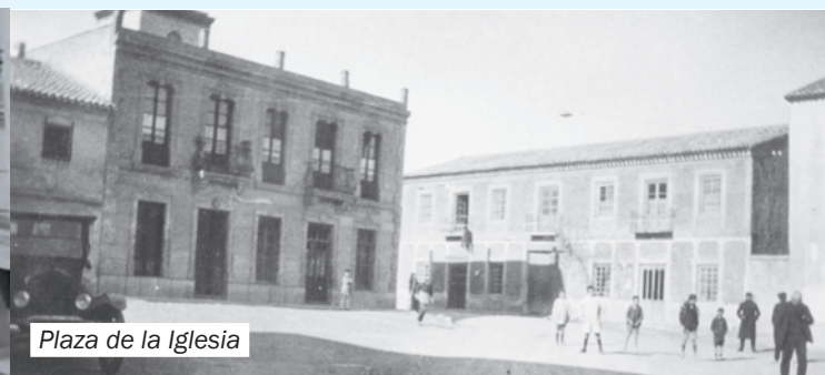
Plaza de la Iglesia

Se inauguran Centros de la Mujer y locales de Asociaciones de Vecinos en Diputaciones, dos nuevos puentes sobre la Rambla del Fraile, las llamadas Rondas, nuevas plazas como la plaza del Agua, dos Museos y dos salas de exposiciones de Arte (Sala José Hernández en la Casa de Cultura y Ermita de San Roque). El nuevo Museo de la Villa dedicado a etnografía, historia y pintura (colección de arte de los premios del Concurso Internacional de Pintura Villa de Fuente Álamo). El Museo del Agua, en un antiguo y gran Aljibe del siglo XIX.