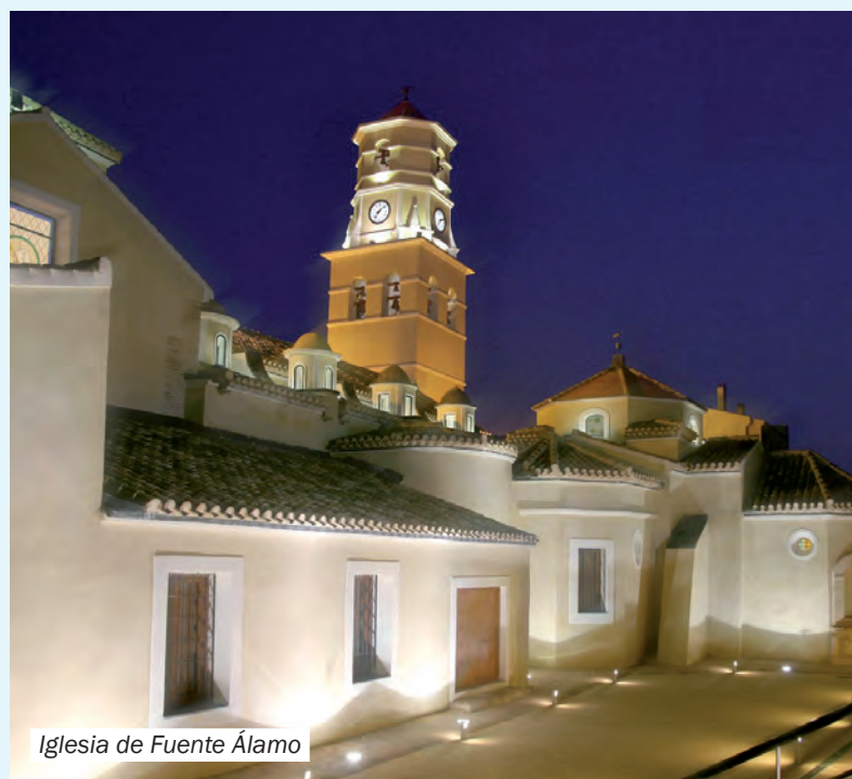
Iglesia de Fuente Álamo