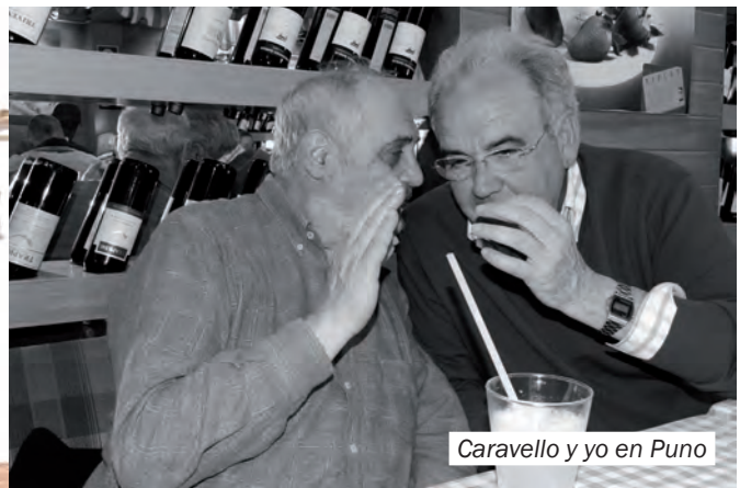
Caravello y yo en Puno