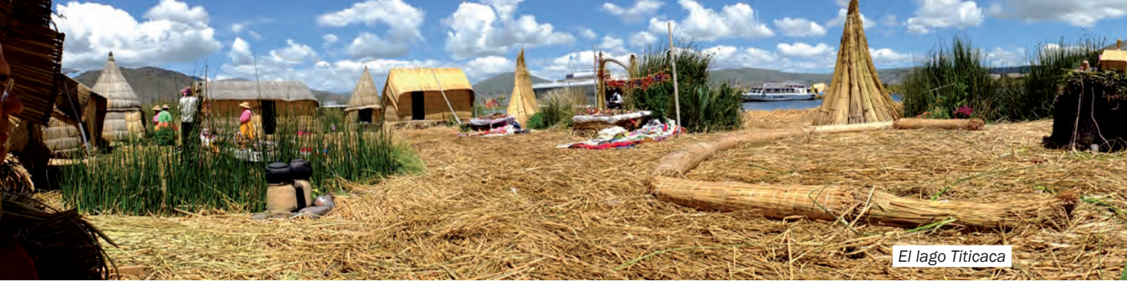
El lago Titicaca

el titi y los bolivianos se quedaron la caca”. Todavía no me he percatado de la gran rivalidad que existe entre los peruanos, los bolivianos, los chilenos y los argentinos.