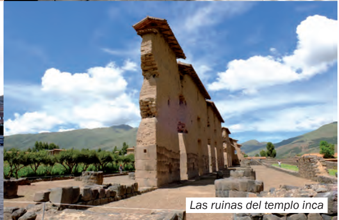
Las ruinas del templo inca