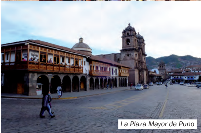
La Plaza Mayor de Puno