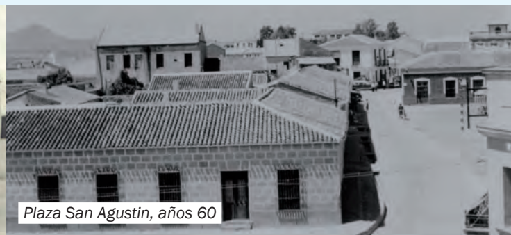
Plaza San Agustín, años 60